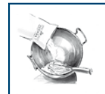
2. Bavaroise Fond mit Wasser verrühren