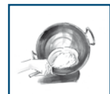
3. Geschlagene Sahne unterheben