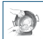
1. Sahne aufschlagen